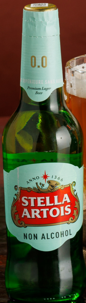
Стелла Артуа безалкогольное